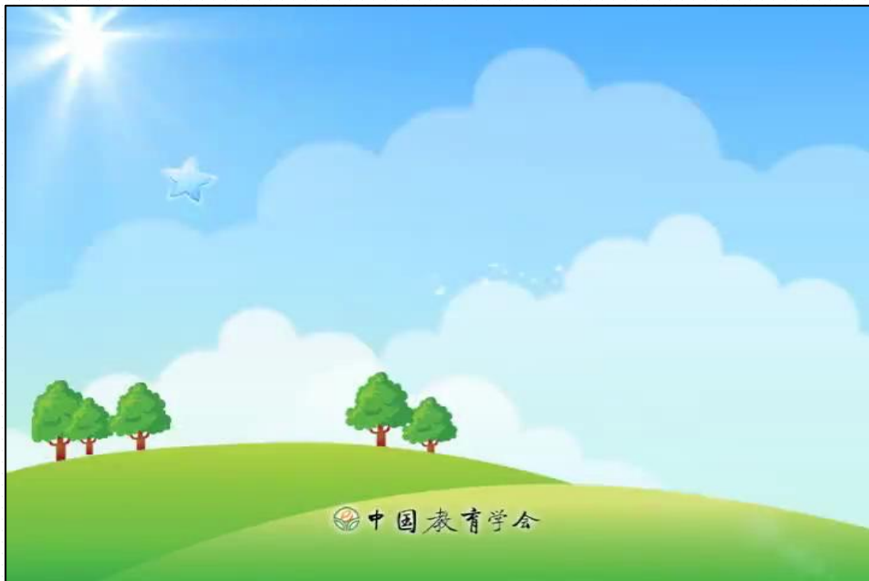
阻止校园欺凌视频